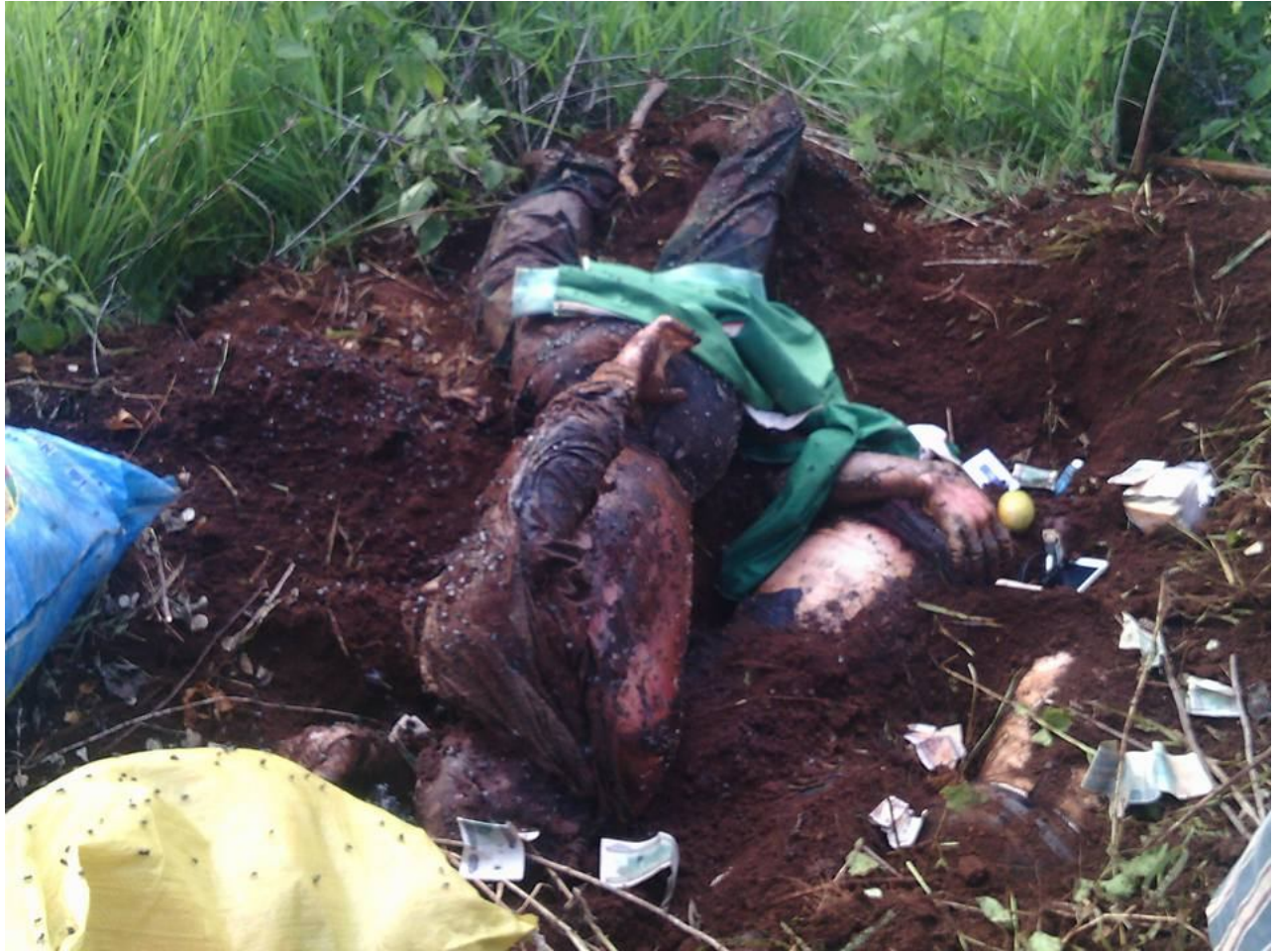
ဇွန်လ ၂၉ ရက် ၂၀၁၆ခုနှစ် တွင် ဝမ်ကစ်ရွာသား ၃ ယောက်အလောင်းအား တွေ့ရှိ

စစ်ဘောင်ဘီဟာသူနဲ့တအားကြီးတယ်။အဲ့ဒီစစ်ဘောင်ဘီဟာ သူ့ဘောင်းဘီမဟုတ်ဘူး” အဲ့ဒီဘောင်းဘီဟာ သူတို့ဟာမဖြစ်နိုင်ဘူးဆိုတာသိသာတယ်။