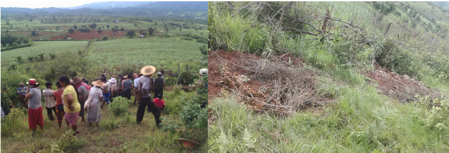
ဇွန်လ ၂၉ ရက် ၂၀၁၆ ခုနှစ်တွင် မြှုပ်နှံထားသော ရွာသား ၅ ယောက်အားရှာဖွေ

ဇွန်လ ၂၉ ရက်နေ့မှသာရွာသားတို့အား သူတို့၏ ယာထဲသို့သွားရန်အခွင့်ရမှသာ ရွာသားများက ပျောက်ဆုံးသွားသောရွာသားအား ပြန်လည်ရှာဖွေခွင့်ရသည်။ပထမ အစတွင် ဆိုင်ကယ်စီးသူ ရွာသားနှစ်ယောက်အား သေနတ်ဒဏ်ရာဖြစ် လမ်းမတွင် သေဆုံးနေသည်ကိုတွေ့သည်။သေဆုံးသူအလောင်းအား ဒရွတ်ဒိုက်ဆွဲပြီး လမ်း၏နားဘေးတွင် အပင်နှင့် အခြားသောသစ်ရွက်တို့ဖြစ်ဖုံးအုပ်ကာထားသည်။ပထမပိုင်းတွင် သေဆုံးသူနှစ်လောင်းသည် မည်သူမည်ဝါဆိုသည်ကို မမှတ်မိကြပေ။