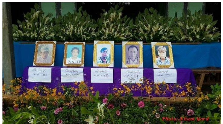
ဇူလိုင်လ ၂ ရက်နေ့ ၂၀၁၆ ခုနှစ် မိုင်းယော် ၌ အသုဘဈာပနာ တွက် ဆွမ်းကပ်မှုပြုလုပ်

ဇွန်လ ၂ ရက်နေ့တွင် မိုင်းယော်မြို့၊ ဝိဟာရ ဘုန်းကြီးကျောင်းတွင် သေဆုံးသူ ရွာသား ၅ ဦး၏ အသုဘ ဈာပနာ တွက် ကောင်းမှုကုသိုလ်များပြုလုပ်လှူဒါန်းပေး သည်။လားရှိုးမှ ဘုန်းကြီးကျောင်း အပါဝင် ဘုန်းကြီးကျောင်း ၄ ကျောင်း ပင့်ဖိတ်ခဲ့သည်။သေဆုံးသူ အလှူဒါန အတွက် ဗုဒ္ဓဘာသာ နှင့် ခရစ်ယာန်ဘာသာ၊ ရှမ်းနှင့် တအာင်း ဓလေ့အတိုင်း ကောင်းမှုကုသိုလ်များပြုလုပ်ပေးခဲ့သည်။