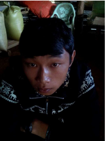
လာ်းထုခမ်း