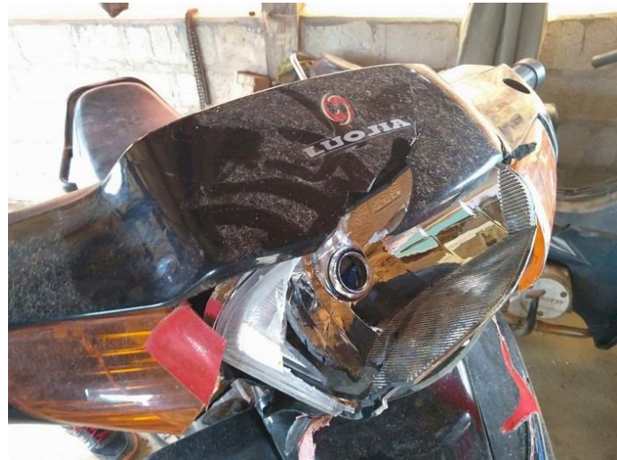
ရှုတ်.ခိုင်းကခ်သိုက်မာခ်းပေ့.ဂျှူး

ဗွင်းသိုက်မာခ်း၊ ခမယ 501 ရွတ်းတီးဂုင်းရှပ်ဝါခ်း၊ ပိုင်းခိမ် ကခ်မီးလင်ဂူခ်း 38 လင် ယပ်.ခေခ်. ဂူခ်း ဝါခ်းသွင်ဂေ့.ကခ်ခပ်ရွင်.မးသုင်,တောင်းခေခ်. လာတ်းသိုက်မာခ်းဝျး သီခ်းတောင်းခေ. တောင်း ခေျး ချးကမ်,ရှူးလီ ပို.ဝံ.တီးခေ; ချးတေခပ်ဂျှူးရွင်.ဂူခ်းရှူး.တောင်းမးသုင်, သိုက်မာခ်း၊ ခိုခ်းလာတ်းဝျး ပေးထိုင်ဝါခ်းယူ,ယပ်. ရှပ်းခပ်ဂျှူးလွမ်းဂခ်ယပ်.၊ ရှပ်းကမ်,ပို. ယပ်.တီးခေ;။ ရှိတ်းခေခ်သေ ခပ်ကွခ် ဂခ် ခပ်းဝါခ်းပိုင်းခိမ်းဂျှူး။ မိုဝ်းဗွင်းခပ်တိုက်.ခပ်း ဝါခ်းယူ,ခေခ်. ရှပ်သိုက်မာခ်းပေးထိုင် ခွင်းဝါခ်း ယပ်. ရှပ်မခ်းသမ်.မီးတီးဂုင်းရှပ်ဝါခ်း။ ဗွင်းခေခ်.မာ်,တိုက်, တီးရှပ်ဝါခ်း (2)လုက်; ယာခ်ဝါခ်း 45 ဝျးသေ လာ်,မာ်, တိုက်.သ့, သိုက်မာခ်း ခပ် တံာ်(2) ဂေ့.တီး ခေခ်းဂမ်းလီပ်။ ရှိတ်းခေခ်သေသိုက်မာခ်း ထာင်, လုမ်းယိပ်းခွင်းဂာင်, မီးရှိမ်းခေခ်.ခေခ်ငလးရှိုင်.ဂာင်.ယိုင်းလွမ်းလိုဝ်းခေခ်.မွက်; (30) ခေျးထီး။ ယွခ်.ခပ် ယိုင်းလူင်ဂျှူးဂူးတောင်းငလး မာ်,ခွင်းခပ်ဂျှူးတိုက်.သ့, ရှိတ်းခေခ်လင် ပိခ်ဂူခ်းပျးဂုလ်။