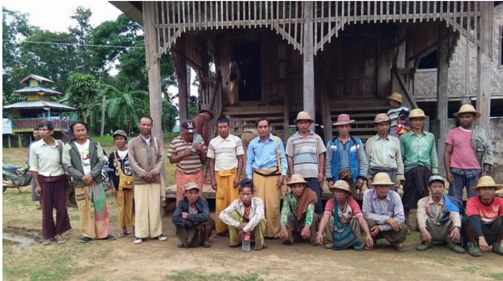
ဂူခ်းဝါခ်း;ကခ်သိုက်မာခ်း;ဂွင်.ဂျ,သုင်,တင်း

ဝံးခေံ.ယပ်. သိုက်မာခ်း;ခိုခ်းပွဲ,ပခ်းဂူခ်းဝါခ်း; ပိင်းခိမ်လး;ဂူခ်းဝါခ်း;ကံက်.ဂျီး 15 ဂေ့. မိုဝ်းရှိုခ်း ခိုခ်း။ ဂူဏ်းဂး; ဂူခ်းဝါခ်း;ပါင်ဂံခ်ထိင်း; 2 ဂေ့.ခေခ်.လး.သိုက်မာခ်း;ယင်းပံ,ပွဲ, ဝခ်းခေခ်.၊ ခပ်လံး; ယူ, လွမ်းသိုက်မာခ်း;တေျ,ထိုင်ဝခ်းထိ 9/8/2018 ဝခ်းကခ်ခပ်ကွက်,ဝါခ်း;ဂျ, ခေခ်.ယပ်.။