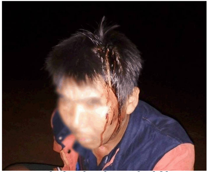
လုင်းဂင်.ဂေ.ဝိ. ကခင်းဂျးပေး.တီးဂျူပ်တိတ်,