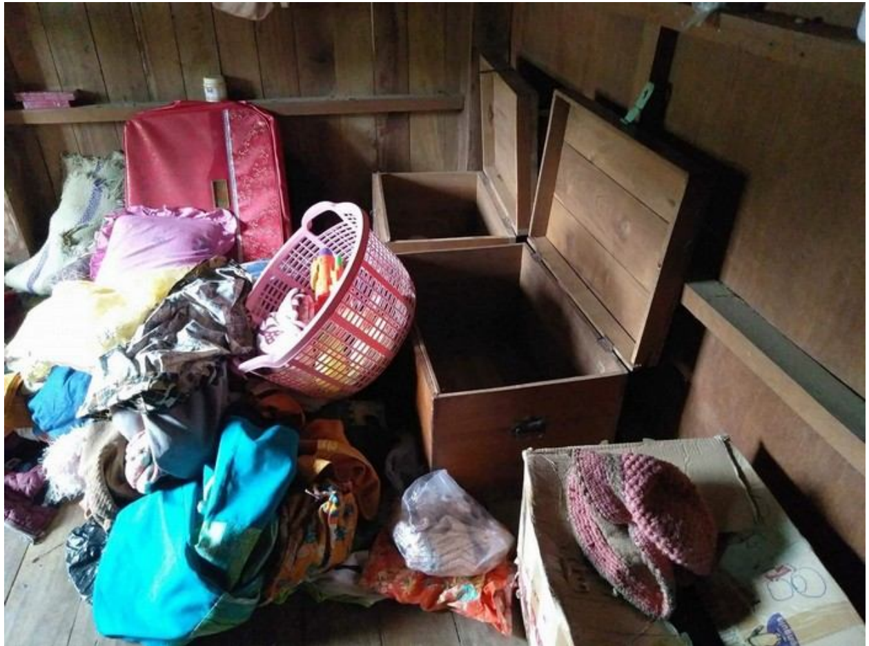
ခူဝ်းရှိုခင်းဂူခင်းဝါခင်းကခင်းလးသိုက်မာခင်းခူခင်းသွက်;တပ်

မိုဝ်းဝခင်းထိ 9/8/2018 ယမ်း 10 မှင်းခိုင်းခခင်း.သိုက်မာခင်းသမ်တပ်.ရှင်- ခမယ 504 ခွင်ခိုဝ်၊ ခမယ 505 ခခမ်.လခင်း; ခလးခမယ 506 ကခင်းယူ,ပးတိုး တပ်.ငဝ်းငုခင်းဂမ်းဂမ်ခခင်းဂါခင်းယခင်း,သိုက် လဂခ 1 ခင်း တိုင်းသိုက်လိုင်,ရှင်,ဝခင်းကွက်, (လးသိုင်း) ခဝ်းဂျးခင်းဝါခင်းပိုင်းသေ. ကိုင်း,ပင် လခမ် ခလးပိုင်း ရှမ်း ခမး သေတိုက်ယးခဝ်းရှိုခင်းပးမခင်း။ သိုက်မာခင်းလက်.ကပ် ငိုခင်း 190,000 ရှပ်း၊ ဗူခင်းခိုင်းလက်; ခိုင်းသွင်းရှိုင်း/ထတ်; (Power Bank) ခလးခူခင်းသွက်;တပ်တိုက်; ခူဝ်းရှိုခင်း ယင်းယင်းဂျးမူတ်း။